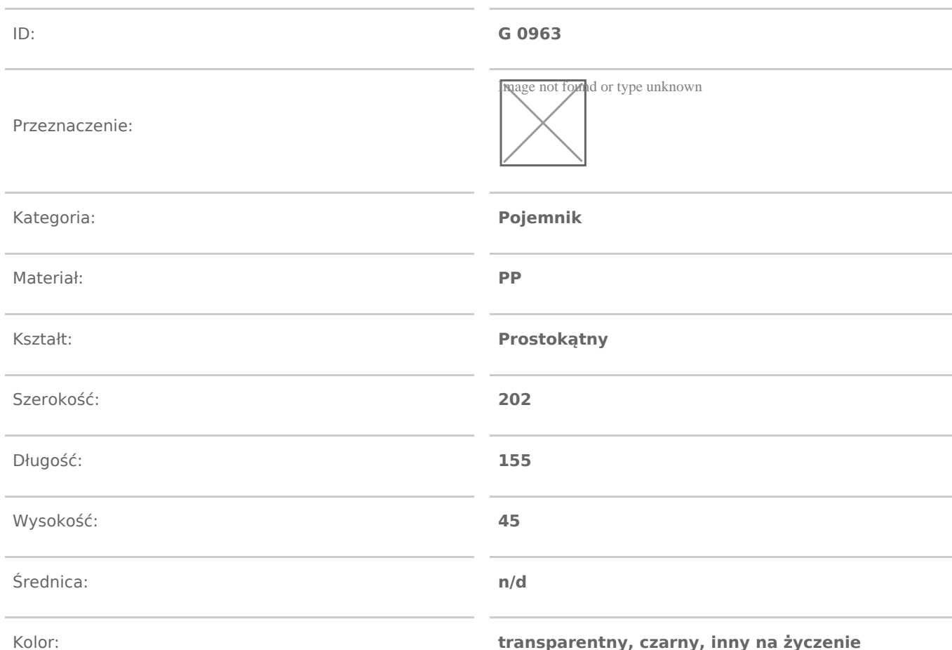
Image not found or type unknown